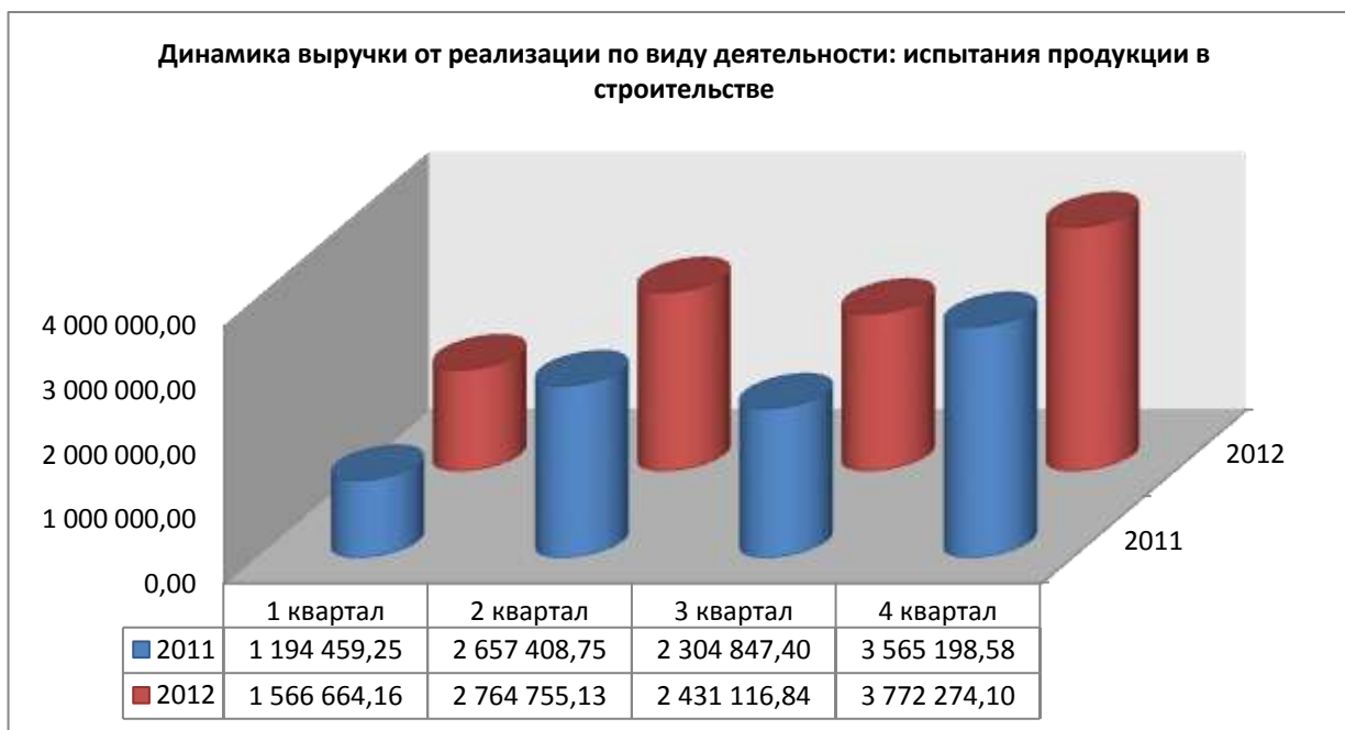
Динамика выручки от реализации по виду деятельности: испытания продукции в строительстве

В состав испытательного центра «КРАССТРОЙ» входят лаборатории: